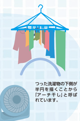
つった洗濯物の下側が半円を描くことから「アーチ干し」と呼ばれています。

洗濯物同士が近かったり接していたりすると風通しが悪くなり、洗濯物が乾くのに時間がかかり、生乾きのニオイの原因にもなります。洗濯物同士の間隔をあけて干すのはもちろんのこと、丈の短いものを中央に、丈の長いものを外側に干す「アーチ干し」で風通しをよくしましょう。扇風機やサーキュレーターは洗濯物に直接風が当たるように置きましょう。下方向から上へ向かって当たるように置くとより効果的です。服は裏側のほうが複雑に縫いあわせてあり、面積が広がっているので、より広い面を風が当たるために裏返して干すと乾きが早くなります。とくにポケットがついて厚みが出やすいズボンなどは裏返して干すと効果的です。